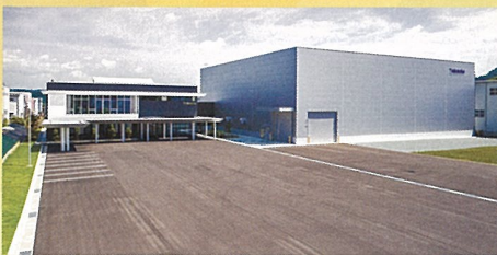
武田機械様 新社屋・新工場

エスアンドケー販売 MSTコーポレーション オーエスジー カネテック ギケン コガネイ サカエ サンドビック ジェービーエム 昭和電機 スイテン 住友電気工業 大昭和精機 タンガロイ THK ナカニシ 日動工業 日研研究所 日本精工 日本トムソン 日立工機 不二越 ミットヨ 三ツ星ベルト をくだ屋技研 (50音順)