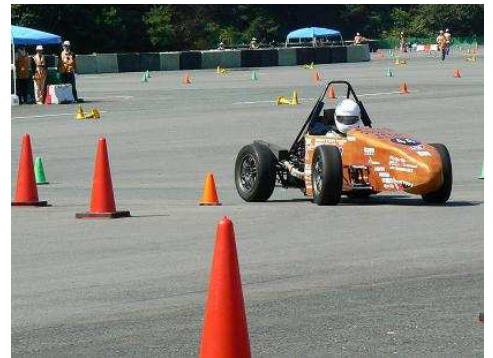
エンデュアランス走行